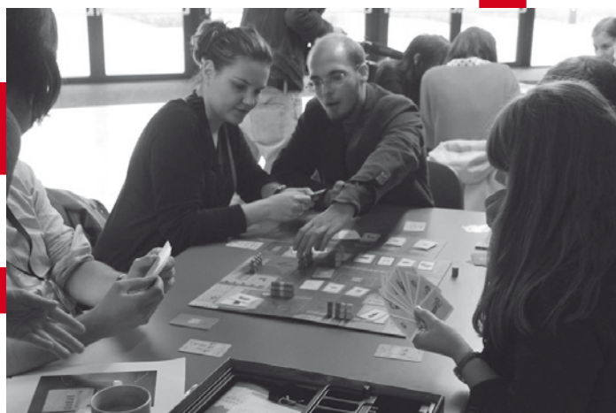
Realia społeczno-gospodarcze czasów PRL można poznać nie tylko w czasie wykładu z historii. Uczestnicy, grając w grę „Kolejka”, toczą bój o towary w sklepie z czasów wielkiego kryzysu