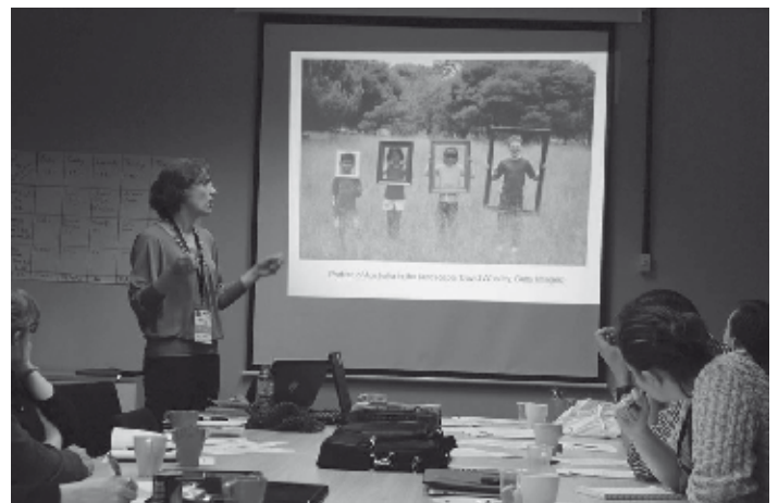
Spotkanie w międzynarodowym gronie to doskonała okazja, by przeanalizować mechanizmy powstawania stereotypów oraz ryzyko związane z pisaniem o innych kulturach. Warsztaty: Journalism about the Other. How to avoid „the danger of a single story”