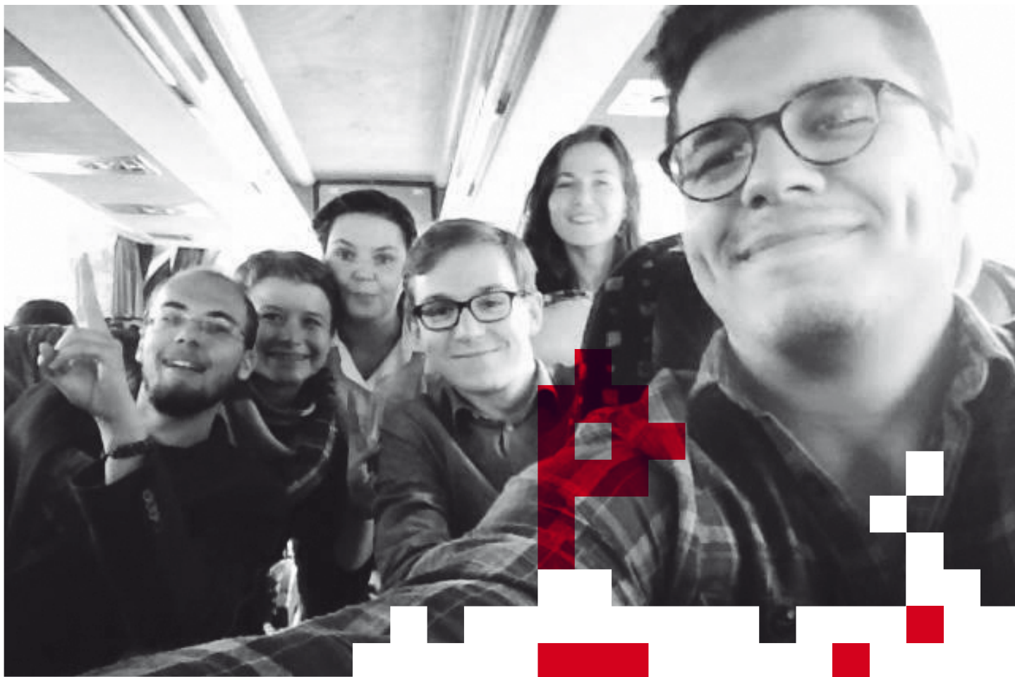
AKADEMIA SOLIDARNOŚCI to też możliwość poznania wspaniałych ludzi i dobra zabawa