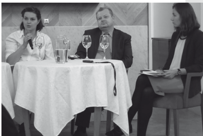
Debaty w Kaliningradzie: Калининград-Гданьск. Прошлое, настоящее, будущее. Uczestnicy obu debat wystąpili w roli zarówno panelistów, jak i prowadzących