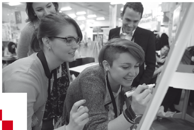
AKADEMIA SOLIDARNOŚCI 2014, warsztat