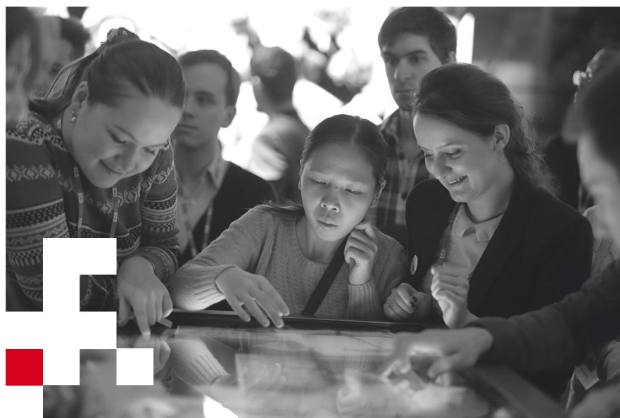
AKADEMIA SOLIDARNOŚCI 2014, zwiedzanie wystawy stałej ECS