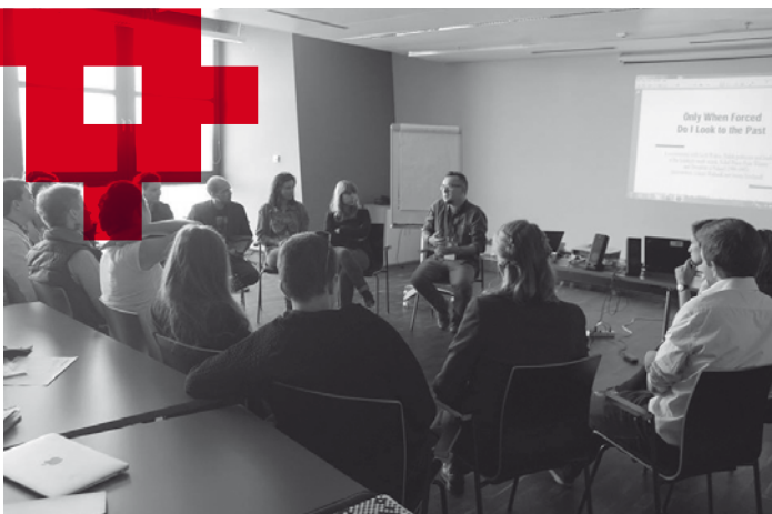
Warsztaty przybierają często formę forum, w ramach którego uczestnicy i prowadzący wymieniają się doświadczeniami, spostrzeżeniami i wątpliwościami

Warsztaty z redagowania tekstów, które prowadzę w ramach AKADEMII SOLIDARNOŚCI, to coś więcej niż tradycyjnie rozumiane szkolenie. Ich celem jest zrozumienie znaczenia, jakie ma praca redaktora. Na pytanie to próbujemy odpowiedzieć wspólnie, opierając się nie tylko na moim doświadczeniu, ale również na dotychczasowych doświadczeniach uczestników. W ten sposób uczestnicy warsztatów mają nie tylko okazję poznać pracę redaktora „od środka”, ale również wziąć udział w praktycznych ćwiczeniach zespołowych i wspólnych dyskusjach. Wydaje mi się, że w dzisiejszych czasach, które cechuje bardzo wysoki poziom konkurencyjności i skandalizacji mediów, jest bardzo pożądane, aby zarówno przyszli dziennikarze, jak i odbiorcy przekazów medialnych, uczestniczyli w tego typu zajęciach.