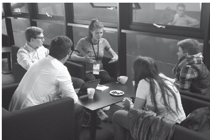
Podczas pracy w grupie dochodzi do synergii potencjałów, dzięki czemu powstają inspirujące projekty