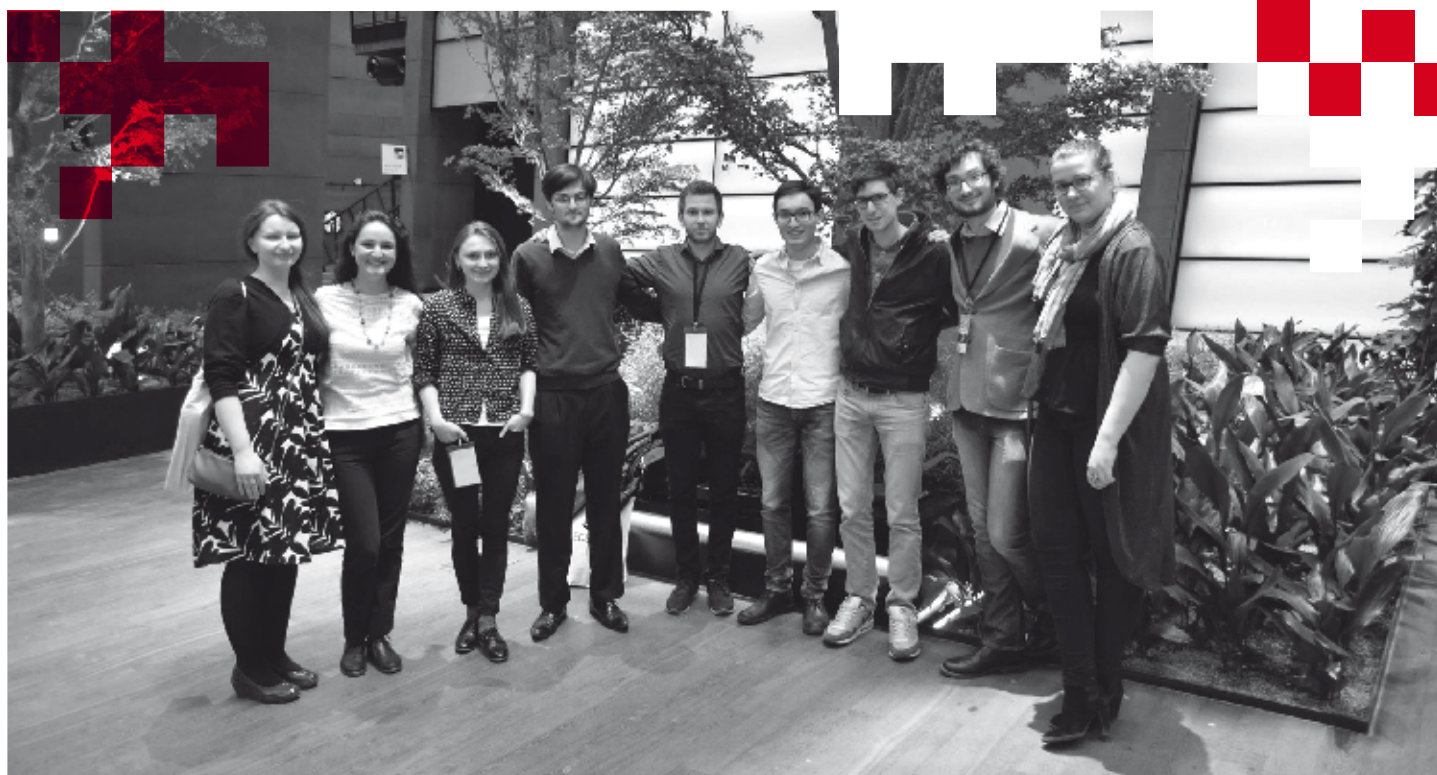
Absolwenci przyjaciele AKADEMII SOLIDARNOŚCI edycji 2013 i 2014 podczas Forum Refleksji Europejskiej „Europa z widokiem na przyszłość”, maj 2015