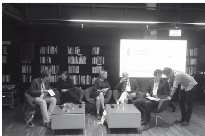
Ostatnie ustalenia przed rozpoczęciem debaty Gdańsk – Kaliningrad: Co-operation in difficult times. Wydarzenie powstało przy dużym udziale uczestników AKADEMII SOLIDARNOŚCI

– AKADEMIA SOLIDARNOŚCI daje możliwość konfrontacji różnych dziennikarskich światów, spotkania i dyskusji o tym, co dzieli, i tym, co łączy nasze doświadczenia. Zajęcia poświęcone sztuce wywiadu dziennikarskiego to dla mnie przede wszystkim forum, na którym możemy wymienić się swoimi spostrzeżeniami, sposobami na to, jak dobrze poprowadzić dyskusję, jak zredagować tekst, na co zwrócić szczególną uwagę przy jego opracowaniu. Staram się, abyśmy wspólnie powtarzając rzeczy, które z perspektywy dziennikarskiej pracy wydają się oczywiste, dochodzili do nieoczywistych wniosków. Podczas AKADEMII taki rodzaj współpracy jest możliwy dzięki wymagającym uczestnikom. A ja lubię, gdy poprzeczka jest zawieszona wysoko.